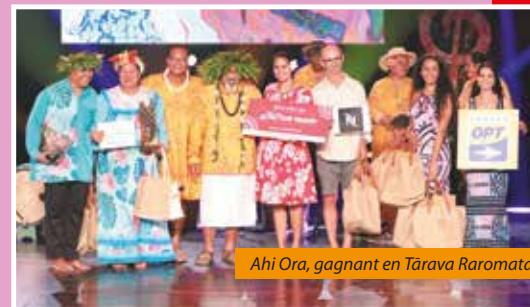
Ahi Ora, gagnant en Tārava Raromata'i

Je suis l'auteur et le compositeur pour le groupe Ahi Ora, que j'ai créé en 2023. Pour le concours, le texte doit être très court, donc on est obligé de synthétiser, d'aller à l'essentiel. J'ai choisi d'écrire sur la valorisation de nos langues polynésiennes. Je sais que ce n'est pas forcément un thème très original, mais il est très important de le mettre en avant. C'est un message fort que je veux adresser, surtout à nos jeunes ; c'est notre combat de parler nos langues, de les transmettre, d'inciter les jeunes à parler, à chanter nos langues. Je suis fier car on a remporté le 1 er prix, on a répété pendant deux mois et demi, une heure et demie par semaine, c'est une belle récompense pour nous tous. »