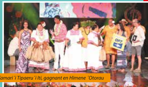
Tamari'i Tipaeru'i Iti, gagnant en Himene 'Otorau

Dans notre groupe, nous étions quinze chanteurs de notre paroisse de Tipaeru'i, nous avons des jeunes chanteurs adolescents et des chanteurs plus âgés, de 40 ans. Deux jeunes filles étaient figurantes sur scène, elles jouaient une femme malade et sa fille. Le fait d'être une petite formation d'une quinzaine de personnes est intéressant car cela nous permet de déceler des talents, des voix, de faire émerger des jeunes. Nous sommes fiers car nous sommes un groupe débutant, sans expérience et nous avons remporté un 1 er prix. Cela a resserré les liens entre les jeunes, leur a donné confiance et nous a donné envie de participer au Heiva. On reviendra chanter au Ta'urua Himene l'année prochaine et on prépare une surprise. »