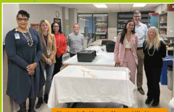
L'équipe du Smithsonian Museum à Washington.