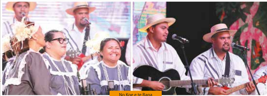
No Koe e te Rapa