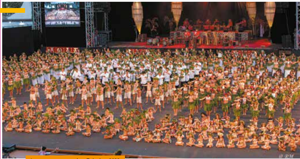
Les portes ouvertes place To'atā en 2023.

HIRO'A JOURNAL D'INFORMATIONS CULTURELLES