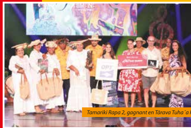
Tamariki Rapa 2, gagnant en Tārava Tuha'a Pae