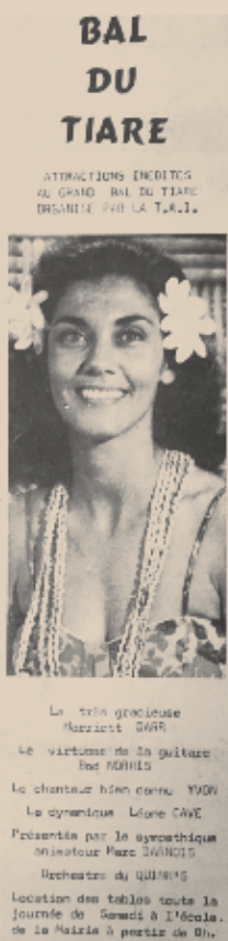
Annonce du Bal du Tiare parue dans les Nouvelles le 29 septembre 1962

« Nous avons sélectionné les artisans en lançant un appel à candidatures. Les candidats devaient répondre à un cahier des charges précis. Parmi les critères, ils devaient soit être patentés, soit être membres d'une association. On a aussi choisi de présenter les différentes spécialités, pour montrer aux touristes l'étendue de l'artisanat polynésien. Nous avons souhaité qu'il y ait de la vannerie, de la bijouterie traditionnelle, de la sculpture sur bois, sur pierre, de la couture, des instruments de musique traditionnelle... Une fois les candidatures reçues, une commission, composée d'un membre du ministère en charge de l'Artisanat, du Port autonome de Papeete, de la cheffe du Service de l'artisanat traditionnel, de Tahiti Tourisme et du syndicat des agents maritimes, s'est réunie et a retenu les artisans en fonction de la qualité de leurs créations,