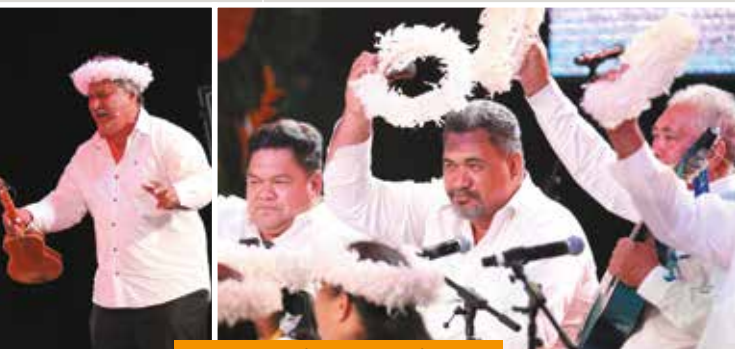
Tamari'i Tuha'a Pae nō Mahina