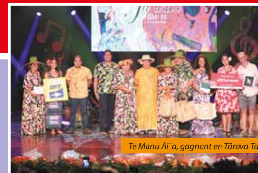
Te Manu Āi'a, gagnant en Tārava Tahiti