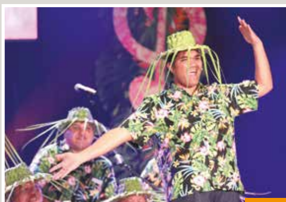
Te Manu Ā'ia