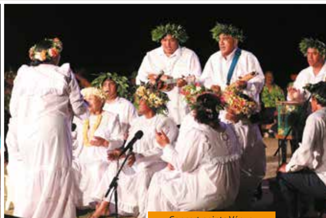
Concert pointe Vénus.